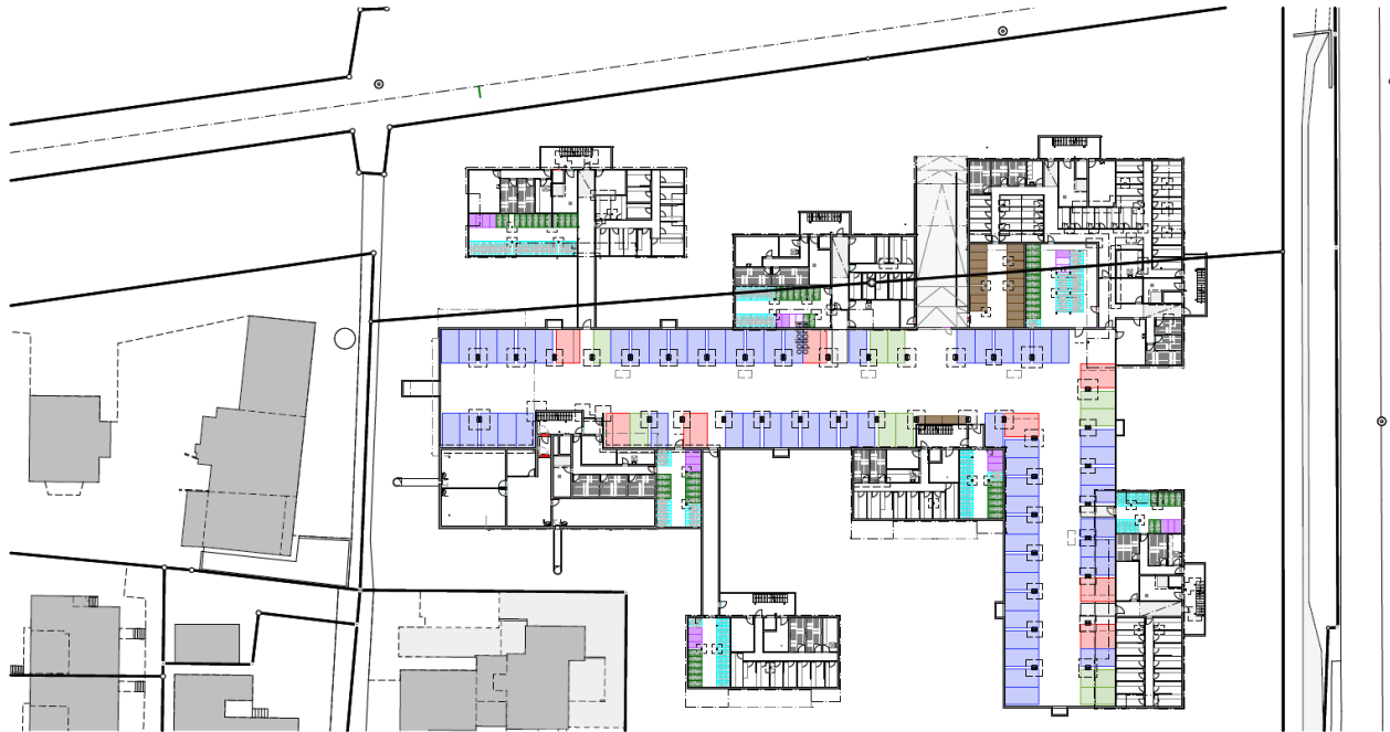
Abbildung 2: Übersicht Abstellplätze Untergeschoss